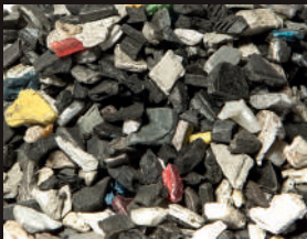
ABS (D3E) ABS (WEEE)