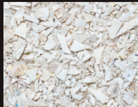
PP chargé Filled PP

MTB propose à la vente des matières plastique recyclées adaptées aux exigences de ses clients.