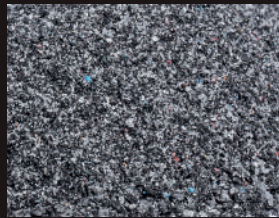
PE réticulé micronisé Cross-linked micronized PE